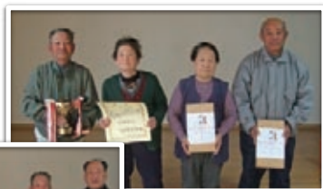
【クロッキー優勝】 小舟下睦美会B

【輪投げの部】 優勝 小舟下睦美会 準優勝 油河内長多楽会 第3位 下小瀬ことぶき会